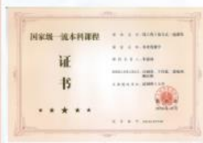
国家级一流本科课程