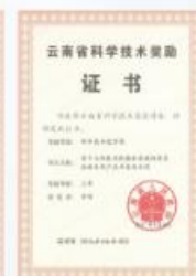
云南省科学技术奖