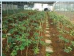
滇重楼精量灌溉技术