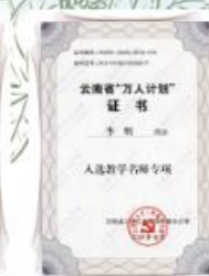
云南省“万人计划”专项证书