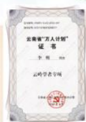
云南省“万人计划”专项证书